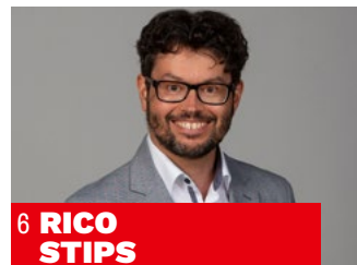
6 RICO STIPS